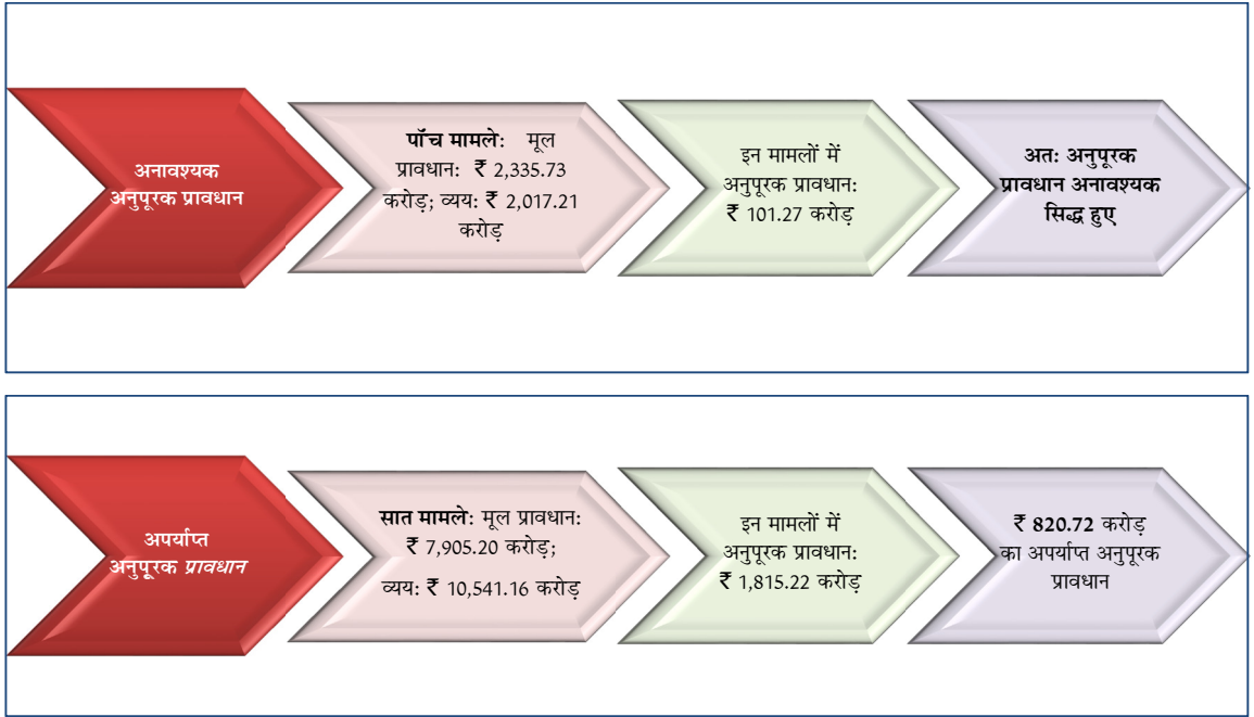
चार्ट 2.4: अनावश्यक, अपर्याप्त अनुपूरक प्रावधान