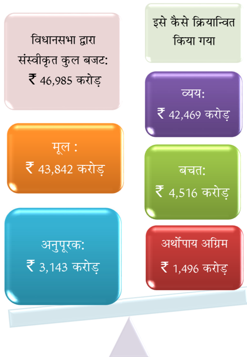
चार्ट 2.2: वास्तविक व्यय की तुलना में प्रावधान की सारांशित स्थिति

वर्ष 2018-19 के दौरान अनुदानों /विनियोजनों के अंतर्गत दर्ज ₹ 4,515.58 करोड़ की कुल बचतें राजस्व प्रवर्ग के 29 अनुदानों व आठ विनियोजनों में तथा पूंजीगत प्रवर्ग के अन्तर्गत 23 अनुदानों व एक विनियोजन में ₹ 5,336.95 करोड़ की बचतें तथा राजस्व प्रवर्ग के अन्तर्गत हुई जिसका समायोजन राजस्व प्रवर्ग के अन्तर्गत तीन अनुदानों व तीन विनियोजनों, तथा पूंजीगत प्रवर्ग के अन्तर्गत तीन अनुदानों व दो विनियोजनों में ₹ 821.37 करोड़ के आधिव्य का परिणाम थी। इस अवधि के दौरान ₹ 4,515.58 करोड़ की कुल बचतें अभ्यर्पित की गई। इस अवधि के दौरान ₹ 42,469.10 करोड़ का व्यय भारतीय रिजर्व बैंक से सरकार द्वारा अस्थाई नकदी संतुलन हेतु लिए गए ₹ 1,496 करोड़ के अर्थोपाय अग्रिमों के पुनर्भुगतान सहित था। इस प्रकार वर्ष के दौरान निवल व्यय ₹ 40,973.10 करोड़ अर्थात् कुल बजट प्रावधान का 87.21 प्रतिशत था। ₹ 821.37 करोड़ के व्ययाधिव्य के लिए संविधान के अनुच्छेद 205 के अन्तर्गत नियमितिकरण की आवश्यकता है।